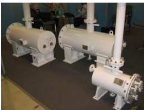
Рис. 4. Ректификационная колонна.

Ректификационная колонна с такой насадкой в несколько раз меньше традиционной колонны, используемой в химической промышленности. Благодаря небольшим размерам такой колонны можно значительно снизить стоимость установки AcomGTL и, как следствие, сделать экономически прибыльным переработку низкодебетных источников метаносодержащих газов.