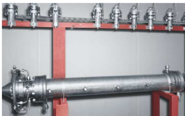
Рис. 2. Реактор гомогенного окисления.

Для достижения максимально эффективной работы реактора, по заказу ОАО "GTL", ФКП «НИЦ РКП», создала систему автоматизированного контроля и управления условиями протекания реакций. Использование такой системы в конструкции AcomGTL позволяет активно управлять физическими условиями в реакторе и химическим составом смеси, что позволяет максимизировать выход требуемой полезной продукции.