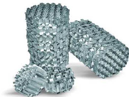
Рис. 3. Пакетная вихревая насадка.

Компания совместно с ОАО «Вихревые Массообменные Установки» (далее - «ВМУ») разработала собственную технологию для высокоэффективной ректификации жидкой смеси углеводородов. Ректификационная колонна осуществляет разделение жидкой фазы на отдельные вещества с использованием изобретения GTL и ВМУ – пакетной вихревой насадки 1 .